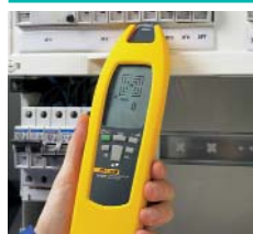
Posizione di fusibili e interruttori e assegnazione ai circuiti