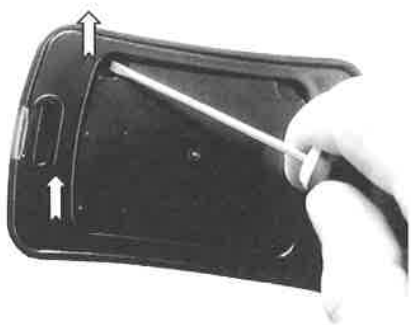
Per togliere il supporto di fissaggio dal dispositivo, agire con un cacciavite come mostrato in figura.

Una volta associato con il ricevitore, scegliere la posizione di installazione tenendo conto dei consigli presenti nella seguente sezione e verificando il corretto funzionamento prima del fissaggio definitivo.