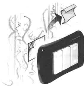
UTILIZZO DI UN BIADESIVO PER L'INSTALLAZIONE SU PIASTRELLE E PARETI LUCIDE O DI PREGIO, QUALI: STUCCO ANTICO, TAPPEZZERIE, PARETI AFFRESCATE Etc.

Per questo tipo di montaggio, il supporto di fissaggio non deve essere utilizzato. Togliero quindi dal dispositivo, prima di incollarlo alla parete.