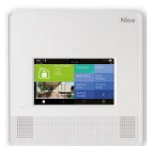
1 MNCUT Centrale wireless con touchscreen integrato