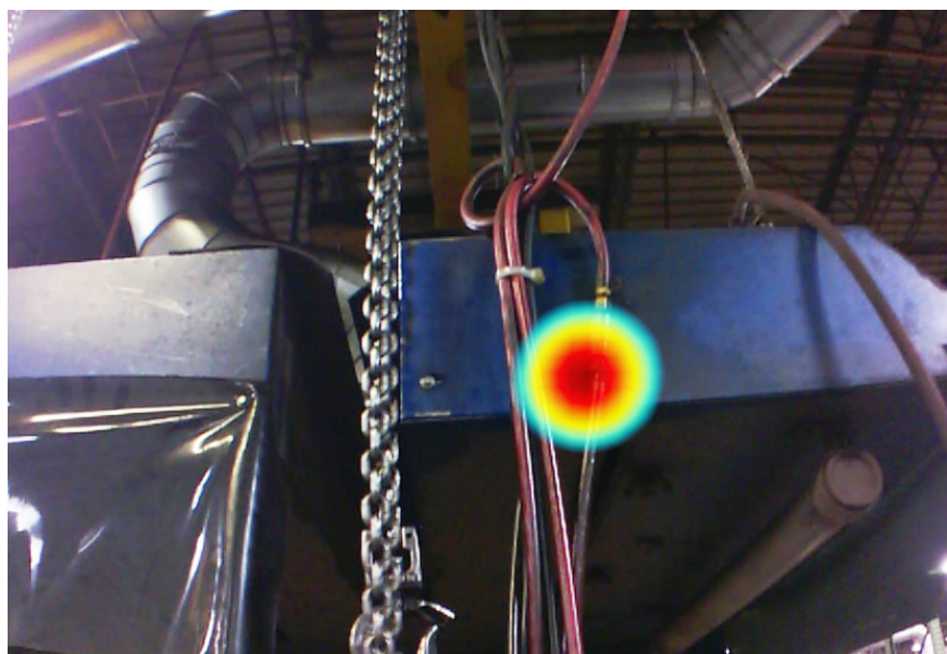
Immagini acquisite con telecamera acustica industriale ii900 in un ambiente industriale.

Fluke. Keeping your world up and running.®