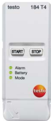
testo 184 T4