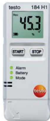
testo 184 H1