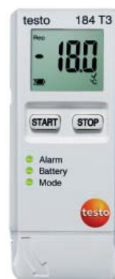
testo 184 T3