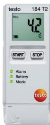
testo 184 T2