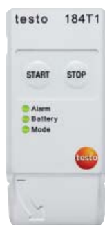
testo 184 T1