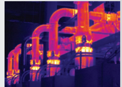
Messa a fuoco MultiSharp