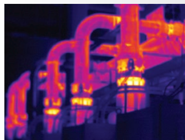
Messa a fuoco manuale