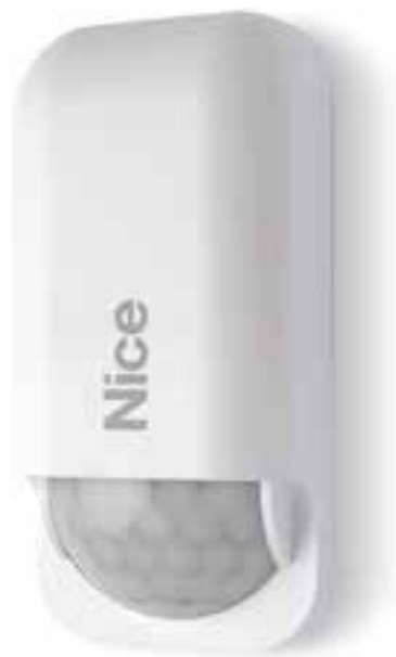
HSA4 SNODO ORIENTABILE A MURO

La struttura della lente permette un'efficace rilevazione grazie a 27 settori posti in 5 diversi piani di inclinazione.