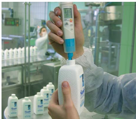
Riconoscimento automatico del valore di fondo scala, ampio display a 2 linee