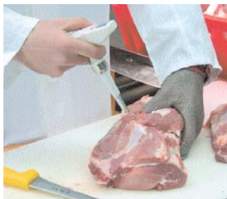
Controlli rapidi in fase di produzione