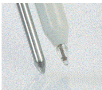
Puntale per pH rivestito con plastica infrangibile