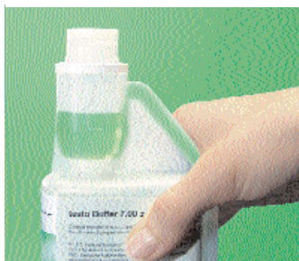
Soluzione buffer pH, in bottiglia con dosatore