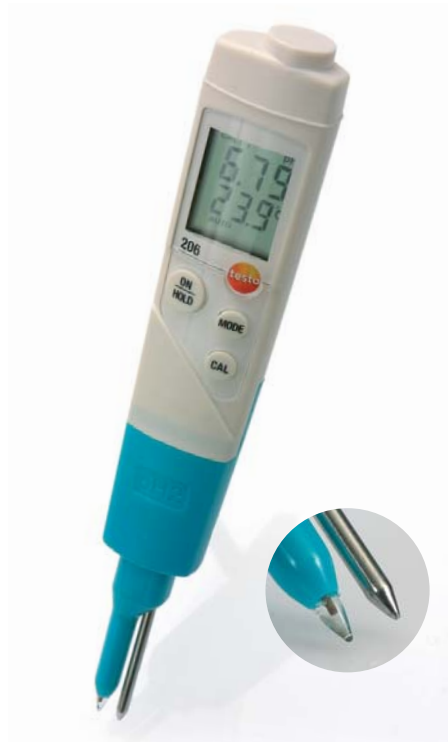
Sonda pH2 adatta a materiali semisolidi