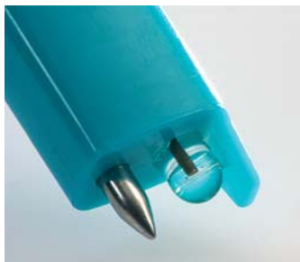
Sonda per la versione pH1, ideale per i liquidi