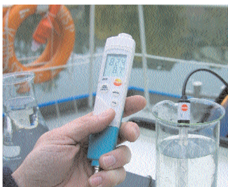
Compensazione automatica della temperatura in sonde esterne con sensore di temperatura