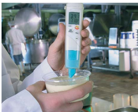
testo 206-pH2 è ideale per misure in sostanze viscoplastiche