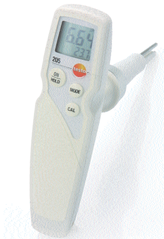
Strumento robusto a penetrazione per pH/C°, con compensazione automatica della temperatura, per il settore alimentare