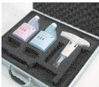
Valigia con testo 205, soluzioni buffer pH 4.0 e pH 7.0, cappuccio di stoccaggio