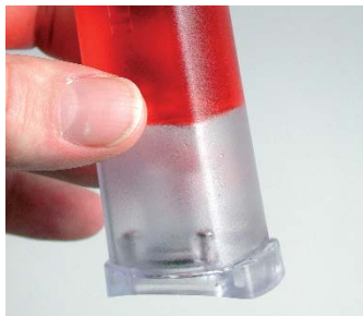
Un apposito gel evita la fuoriuscita della soluzione di cloruro di potassio

La misura del pH riveste un ruolo fondamentale in molteplici campi.