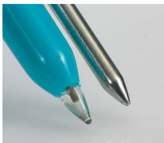
Sonda per la versione pH2, adatta a sostanze semisolide