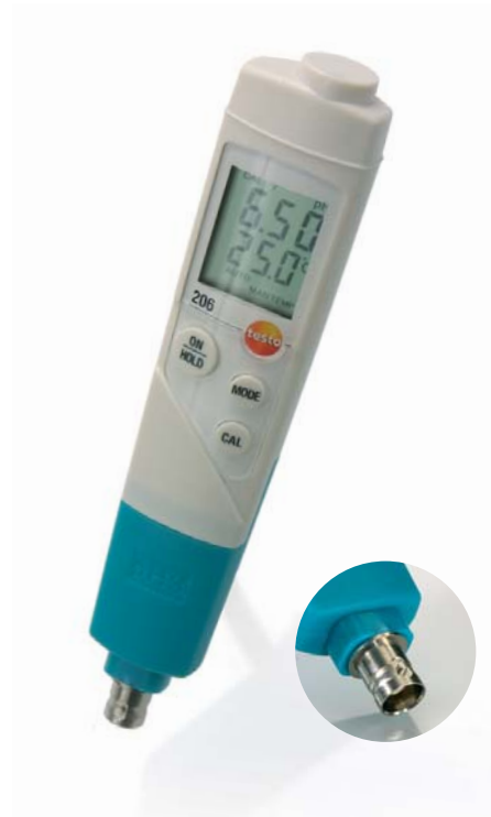
Sonda pH3 con interfaccia BNC