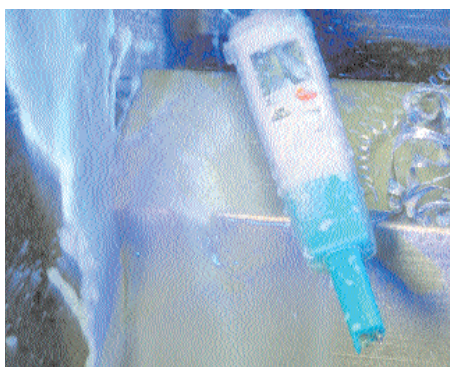
Custodia di protezione "TopSafe" per applicazioni industriali gravose