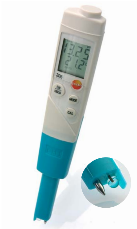
Sonda pH1 ideale per i liquidi