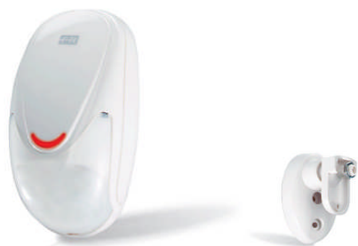
snodo orientabile incluso

IR900 è un sensore ad infrarosso passivo, completo di snodo, con un sistema di calcolo dell'amplificazione del segnale piroelettrico a doppio elemento che garantisce un'assoluta sicurezza contro i falsi allarmi.