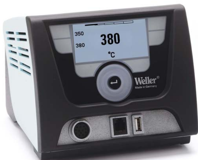
Stazione saldante WX 1