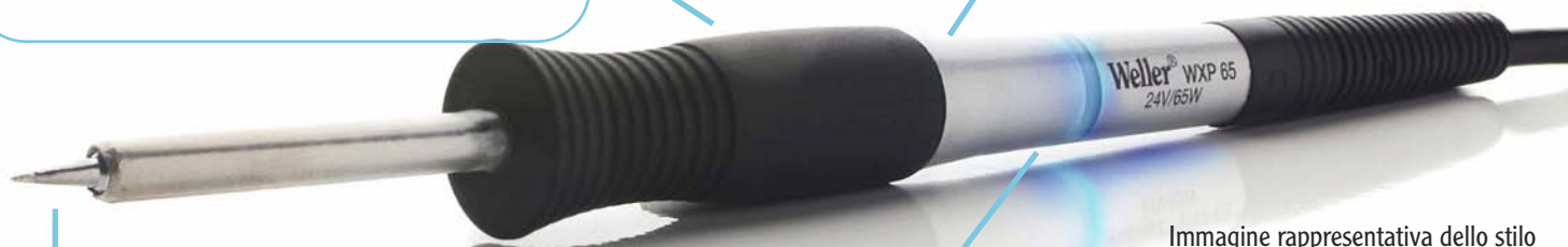
Immagine rappresentativa dello stilo

Il design ergonomico dello stilo WXP 65 rende il suo uso facile e confortevole anche dopo ore di lavoro continuo