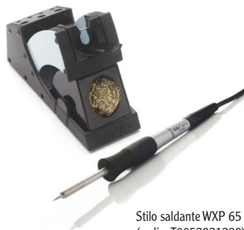
Stilo saldante WXP 65 Set (codice T0052921299)